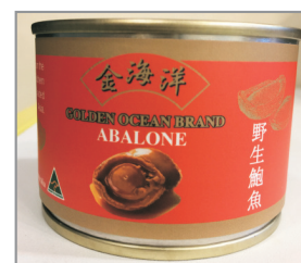
每位成人貴賓 均可獲贈一罐即食鮑魚(備註19)