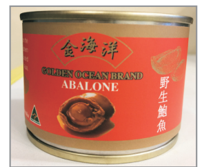
每位成人貴賓 均可獲贈一罐即食鮑魚(備註19)