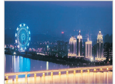
秋水廣場南昌之星

香港→南昌—秋水廣場、遠眺南昌之星摩天輪(遊覽時間約1小時) ~秋水廣場：位於贛江之濱，與滕王閣隔江相望，是一座以噴泉為主題的大型休閒廣場，當中廣場晚上音樂燈光噴泉最為著名。