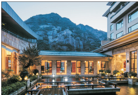
三清山希爾頓度假酒店