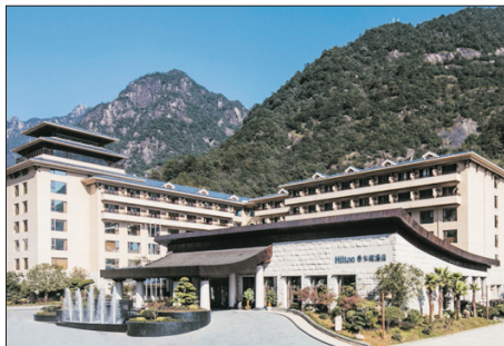
三清山希爾頓度假酒店

#5-8月出發團隊：提升入住國際品牌五星級標準三清山希爾頓度假酒店(Hilton Sanqingshan Resort)