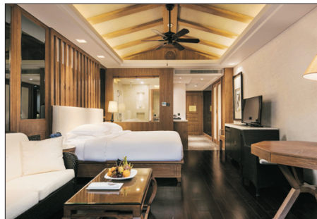
三清山希爾頓度假酒店