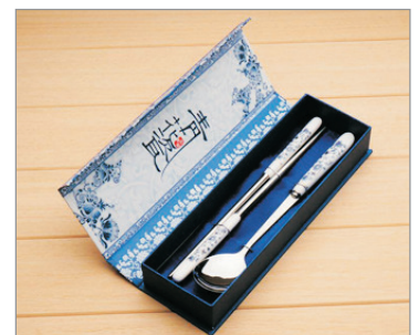
【精美紀念品】 景德鎮青花瓷餐具(每位一套)

三清山—婺源—李坑(遊覽時間約1.5小時)—俞氏宗祠(遊覽時間約30分鐘)—曉起(遊覽時間約30分鐘) ~李坑：一個以李姓聚居為主的古村落，是著名的徽派建築。村落群山環抱，山清水秀，風光旖旎。村中明清古建遍佈、民居宅院沿溪而建，依山而立，粉牆黛瓦、參差錯落；村內街巷溪水貫通；青石板道縱橫交錯，更有兩澗清流，構築了一幅小橋、流水、人家的美麗畫卷。 *三清山至婺源，車程約1.5小時。