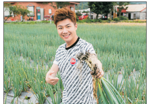
下田拔蔥+蔥油餅DIY體驗