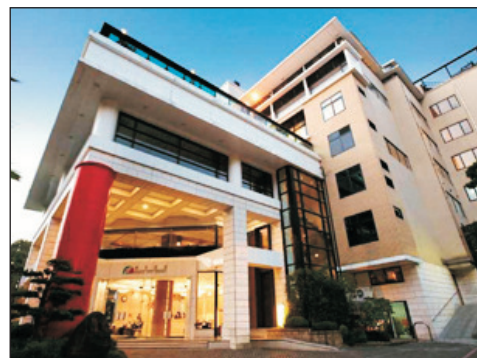
北投春天溫泉酒店

「北台灣最美麗車站」基隆八斗子車站、潮境公園、 西門町、華山藝文中心、林口三井OUTLET PARK、 全日自由活動