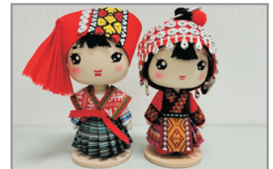
包每位客人1隻 6吋高Q版民族公仔