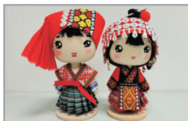
包每位客人1隻 6吋高Q版民族公仔