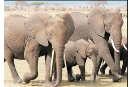
安布斯利國家公園

• 安布斯利國家公園 ：位於肯尼亞南邊與坦桑尼亞接壤的安布斯利國家公園，以主峰高5898公尺之非洲最高峰終年積雪的奇力馬札羅山(MT.KILIMANJARO)為背景，這裏常常可見到的獅子、犀牛、長頸鹿、斑馬、大象、大耳狐、非洲水牛、羚羊類、印度豹等動物。此處自然美景處處展現，只有到這裏狩獵旅行的人，才能體會到拍攝奇力馬札羅山為背景的動物是多麼迷人，是攝影迷的最佳取景地。