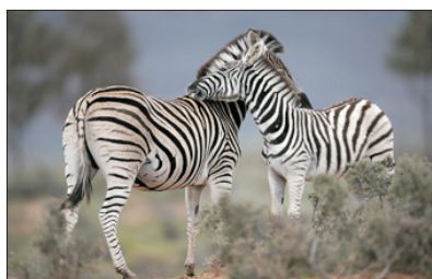
「動物百態」 瑪沙瑪拉野生動物保護區

2. 住宿一晚東非特色的森林酒店 ，置身於酒店或露台中，猶如站在樹頂上，高人一等觀看野生動物的生活百態，更可一睹大象、長頸鹿等動物得意有趣的飲水情況，感覺至新！