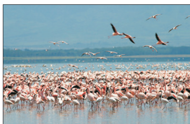
「粉紅色的奇觀」 紅鶴湖

於黃昏及早上遊覽瑪沙瑪拉野生動物保護區，追蹤獅子、大象、長頸鹿、犀牛、狓狓、斑馬以及數不清的非洲羚羊等飛禽走獸，費用全包。