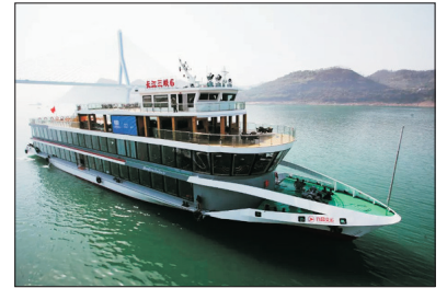
永安獨立包船遊三峽