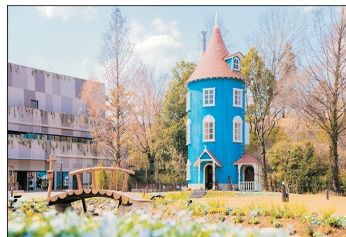
姆明主題樂園 Moomin Valley Park