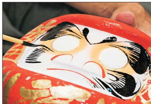
達摩不倒翁點睛體驗