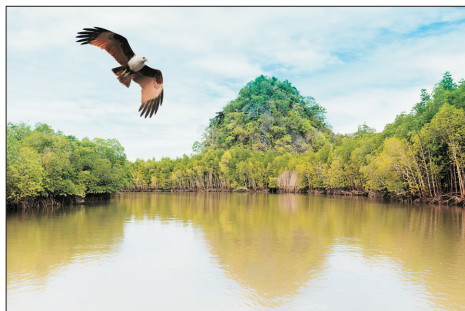
浮羅交怡(馬來西亞)