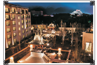
拉薩香格里拉大酒店