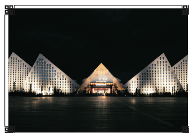
聖地天堂洲際大飯店