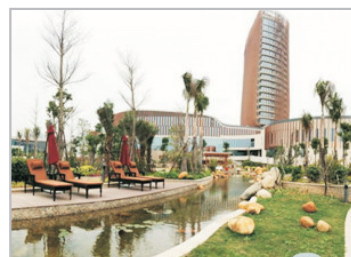
佰翔圓山溫泉酒店