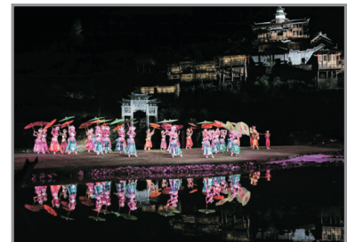
大型山水實景劇《龍船調》

相傳土家族的兩個族長曾為冰釋前嫌，共飲一碗酒，以示友誼與和諧，及後將碗摔碎，以泯恩仇。自此，後人在宴會上在都把酒一口喝乾，然後把碗用力往地下一摔，體現豪氣與情義，亦取「碎碎(歲歲)平安」之意。安排品嚐摔碗酒風味宴，體會獨有宴會文化。