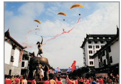
女兒城內民族表演

土家女兒會源於明朝末年，至今已有數百年的歷史，是恩施土家族具有代表性的民族傳統節日，保存了古代巴人原始婚俗的遺風。於每年的農曆7月7日至12日期間擇選吉日舉辦盛會，當天的青年男女會通過對歌的形式尋找意中人，以歌為媒，自主擇偶，故此又被譽為「東方情人節」。