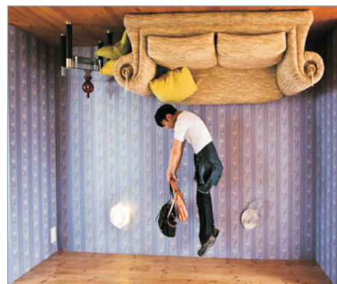
Upside Down House