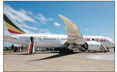
埃塞俄比亞航空—B787客機