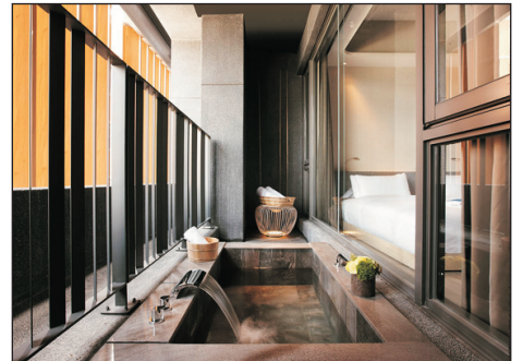
宜蘭礁溪晶泉丰旅客房溫泉池