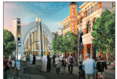
華納兄弟主題樂園