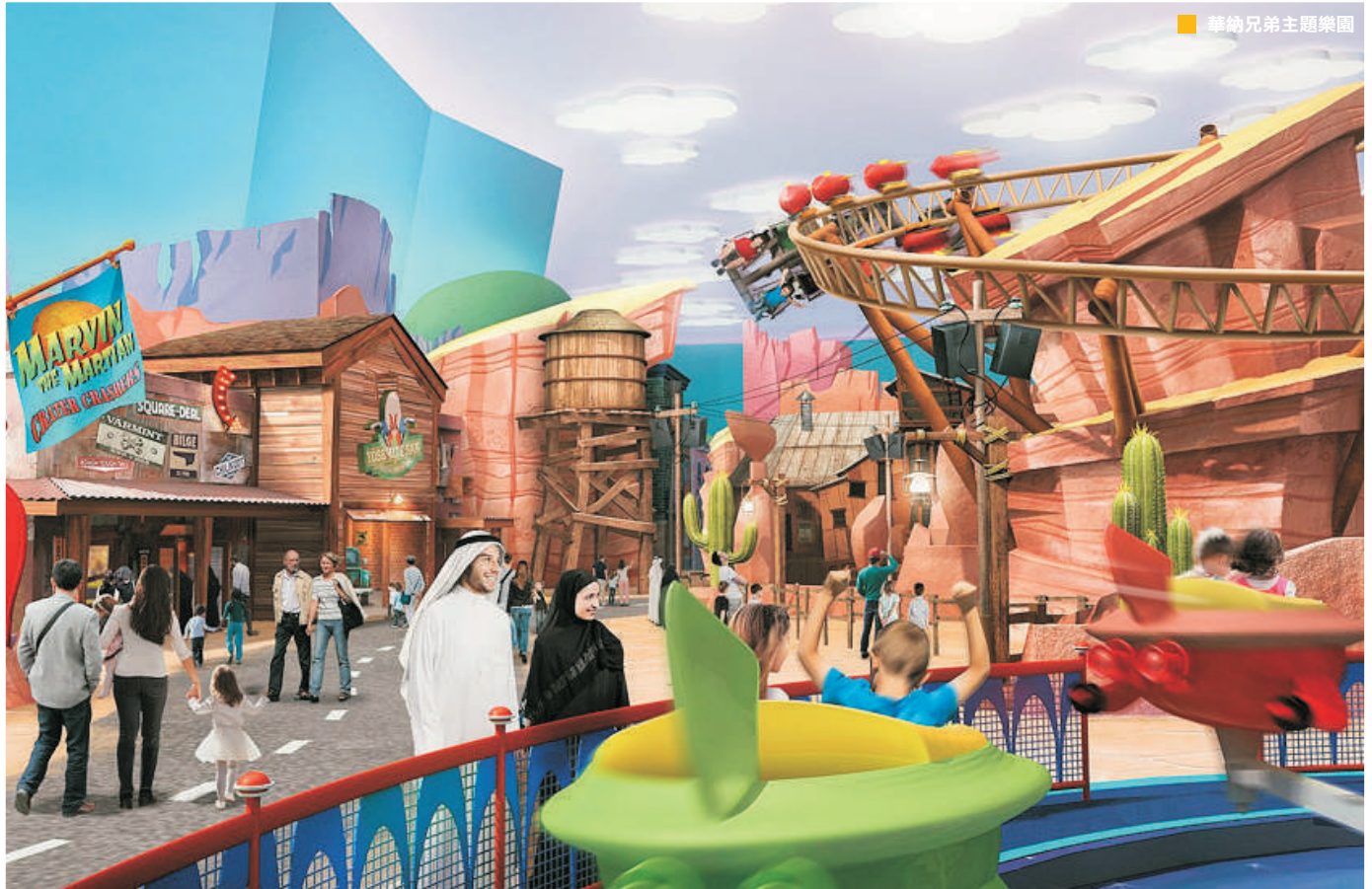
華納兄弟主題樂園

杜拜(哈利法塔、朱美拉古城市集【Souk Madinat Jumeirah】、 全球最大的購物中心【Dubai Mall】、奇蹟花園【Miracle Garden】、 【水上明珠 La Perle by Dragone】)、