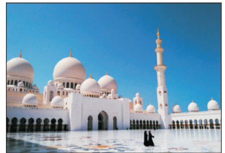
阿布達比大清真寺

* 如遇上當地回教節日或慶典(如：齋戒月等)，肚皮舞表演將被取消，恕不另行通知。