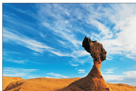
野柳地質公園(台灣)