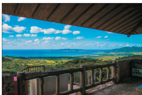
Banna公園展望台(石垣島，日本)