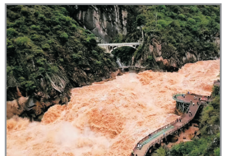
虎跳峽大峽谷景區