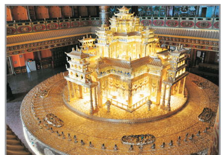
香巴拉藏文化博物館