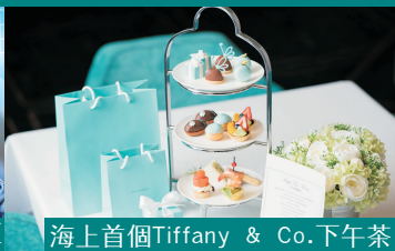
海上首個Tiffany & Co.下午茶