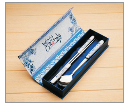
【精美紀念品】 景德鎮青花瓷餐具(每位一套)

#如南昌西站往香港之直達列車滿座，將改為乘高鐵/和諧號前往深圳北站或廣州南站，再轉乘另一列車回港，有關安排將由領隊於出發前通知，客人不能藉此要求退出或要求賠償。