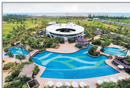
博龍佰悅灣溫德姆酒店