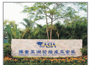
博龍亞洲論壇成立會址