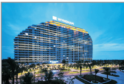
博龍佰悅灣溫德姆酒店