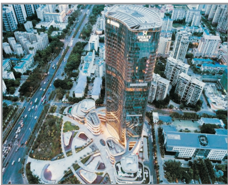
三亞中心凱悅嘉軒酒店

#寶亭荔苑溫泉酒店「荔瓊豪華溫泉房」原名為「山景獨立泡池客房」，房型及房內設施不變。如遇「荔瓊豪華溫泉房」房滿，將安排入住「荔瓊高級溫泉房」（房間均設獨立泡池）。