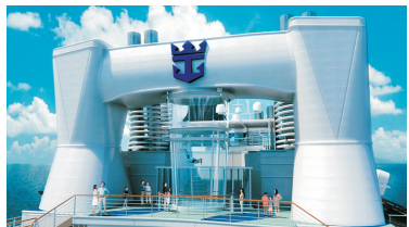
Ripcord by iFly海上跳傘體驗®*