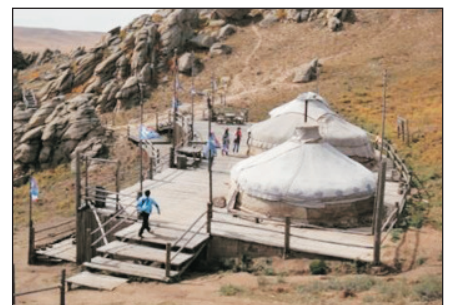
十三世紀文化風情園區