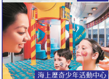
海上歷奇少年活動中心