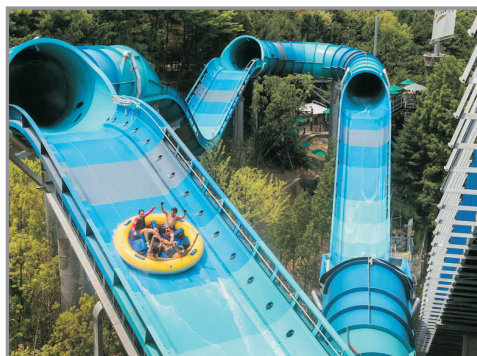
加勒比海灣水上世界