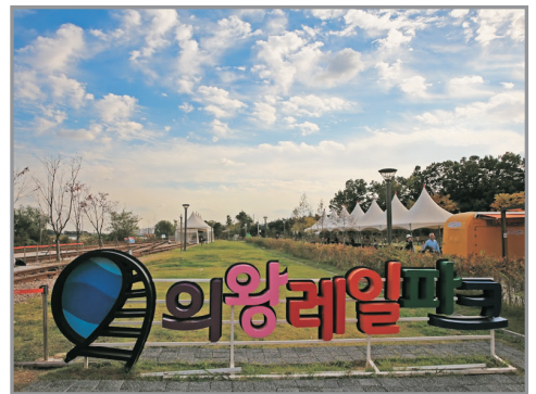
Uiwang Rail Bike體驗