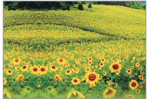
《增遊》太白·九臥牛花海(賞太陽花註1) (7月26日至8月12日出發團隊適用)