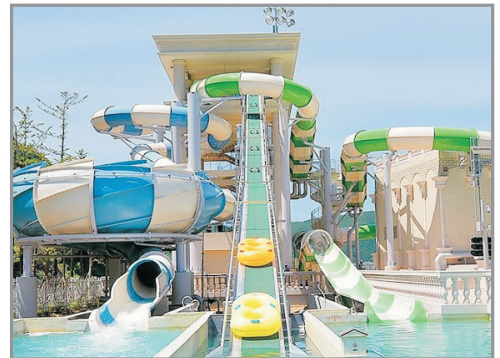
High1 Water World