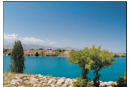
伊塞克湖(吉爾吉斯)