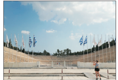
奧林匹克運動會場