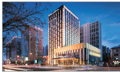
呼和浩特富力萬達文華酒店外觀