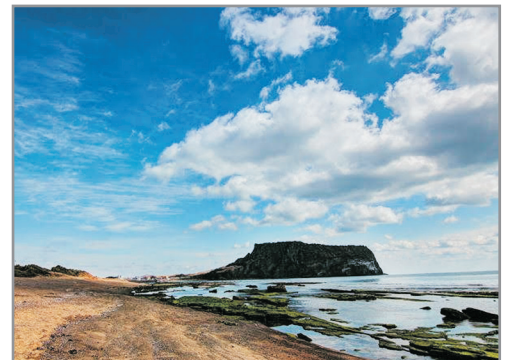
「UNESCO世界自然遺產」城山日出峰