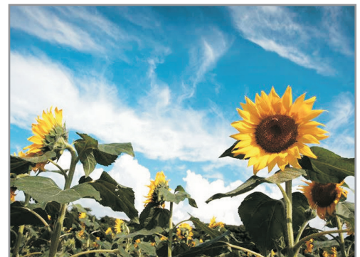
金京淑農場(賞太陽花註1)