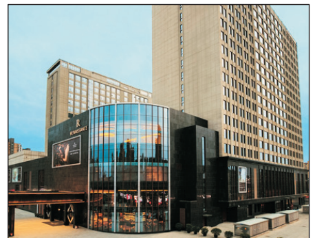
瀋陽太陽獅萬麗酒店

· 太陽獅萬麗酒店於2018年開幕，由國際品牌集團管理。酒店設計精美，採用現代式簡約裝潢，房間內更設有浸泡浴缸，讓客人身心放鬆。酒店提供室內游泳池及24小時的健身中心等設施。