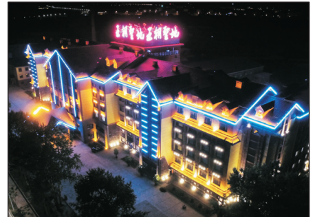
王朝聖地溫泉度假酒店

· 王朝聖地溫泉酒店：座落於長白山池北區，酒店佔地6000多平方米，大堂左右兩側建有祥雲柱，以長白山特有的玄武岩雕琢而成，刻有祥雲圖案，設計氣派非凡。溫泉區重本改造後煥然一新，並已竣工及重新開放供客人可自費享用。(註9)