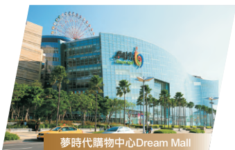
夢時代購物中心 Dream Mall

藍晒圖文創園區： 前身為舊司法宿舍的區域內重現3D的藍晒圖。自從開幕後一直都是年輕族群聚集人潮滿滿的熱門景點，裡面的文創特色小店各有值得探訪之處，公共區域內的彩繪牆與藝術裝置更是園區內的拍照熱區。