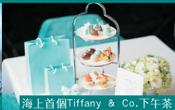
海上首個Tiffany & Co.下午茶