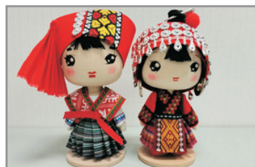
包每位客人1隻 6吋高Q版民族公仔

客人必須於報名時提交正確英文姓名*及證件號碼，以給予鐵路公司作出票之用。如出票後因錯名，錯證件號或出發日期而更改，需辦理退票及重購手續，如因此導致未能重新出票及成行，有關責任須由客人承擔，本公司概不負責。 (*持中國身份證客人必須提供正確簡體中文姓名)