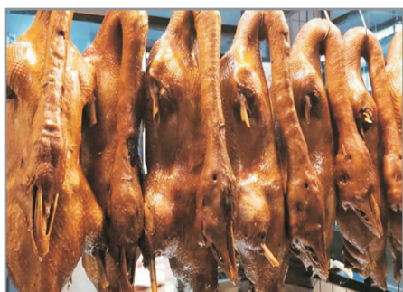
日日香獅頭鵝全鵝宴