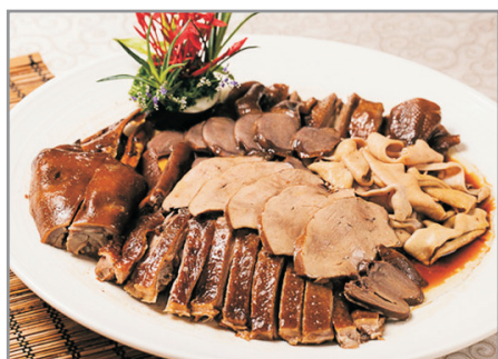
日日香獅頭鵝全鵝宴