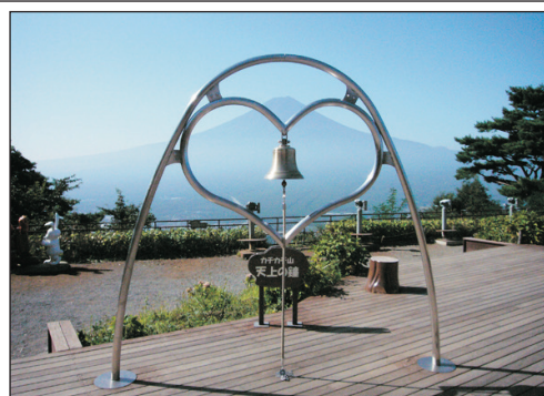
天上山公園天上之鐘