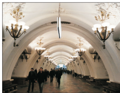
「地下宮殿」 雲石地鐵站

暢遊「世界文化遺產」及俄羅斯經濟、政治中樞～克里姆林宮(包入場)，內裡有多座宏偉而富歷史性的建築物，如沙皇大鐘、巨炮及聖母升天大教堂等，令人嘆為觀止。