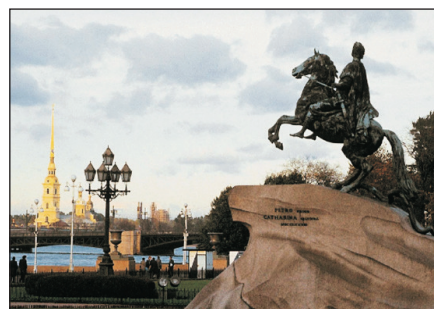
彼得大帝騎馬銅像