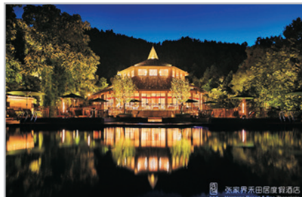
五味坊餐廳+戶外泳池夜景