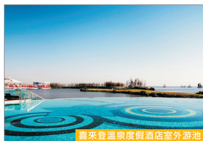
喜來登溫泉度假酒店室外泳池