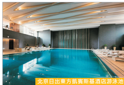
北京日出東方凱賓斯基酒店游泳池