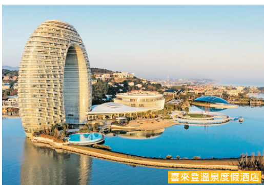
喜來登溫泉度假酒店