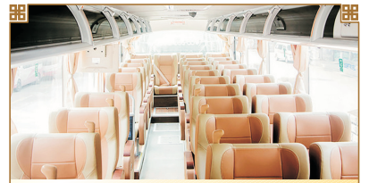
皮座椅商務旅遊車