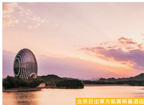
北京日出東方凱賓斯基酒店

酒店為2014年APEC非正式峰會的主要場所之一，國際級領導人之選。坐落於風景如畫的雁棲湖湖畔，毗鄰壯麗的燕山山脈，遠眺慕田峪長城。建築外形新穎獨特，裝飾精緻典雅。40平方米或以上的客房寬敞舒適，房內大幅落地玻璃，將窗外的幽雅景致盡收眼底。酒店建築來自七個國家的60名設計師團隊創作，更因用上20多項世界先進的環保技術而被喻為是一座「會呼吸」的酒店。而健身中心、泳池、桑拿浴室等休閒設施齊全，風格低調而奢華。