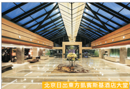
北京日出東方凱賓斯基酒店大堂