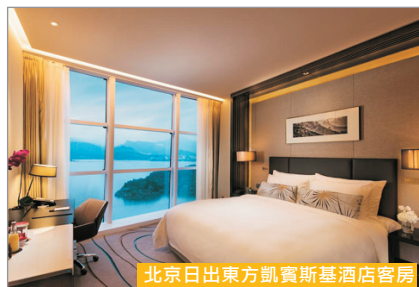
北京日出東方凱賓斯基酒店客房