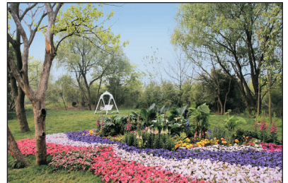
西溪國家濕地公園