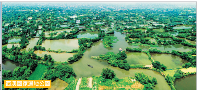
西溪國家濕地公園