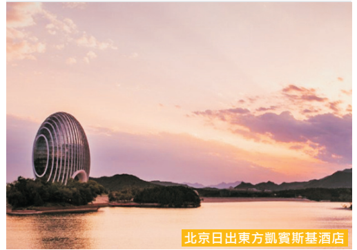
北京日出東方凱賓斯基酒店

酒店為2014年APEC非正式峰會的主要場所之一，國際級領導人之選。坐落於風景如畫的雁棲湖湖畔，毗鄰壯麗的燕山山脈，遠眺慕田峪長城。建築外形新穎獨特，裝飾精緻典雅。40平方米或以上的客房寬敞舒適，房內大幅落地玻璃，將窗外的幽雅景致盡收眼底。酒店建築來自七個國家的60名設計師團隊創作，更因用上20多項世界先進的環保技術而被喻為是一座「會呼吸」的酒店。而健身中心、泳池、桑拿浴室等休閒設施齊全，風格低調而奢華。