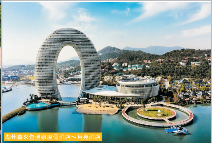
湖州喜來登溫泉度假酒店～月亮酒店