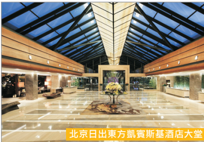
北京日出東方凱賓斯基酒店大堂