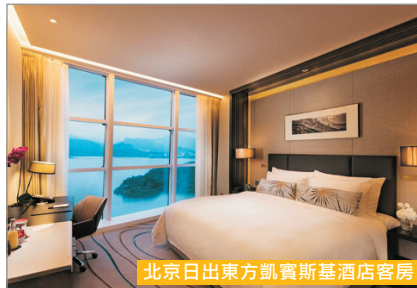
北京日出東方凱賓斯基酒店客房