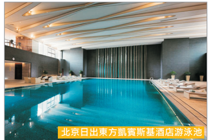
北京日出東方凱賓斯基酒店游泳池