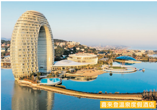
喜來登溫泉度假酒店