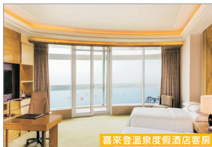
喜來登溫泉度假酒店客房