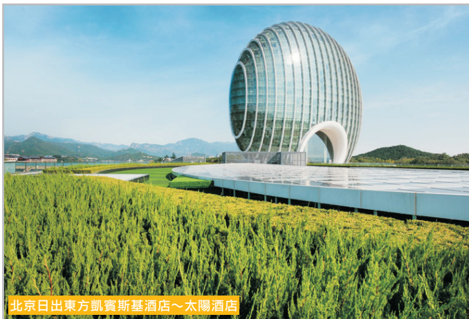
北京日出東方凱賓斯基酒店～太陽酒店