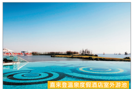
喜來登溫泉度假酒店室外游池