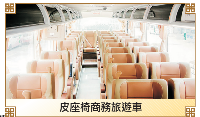
皮座椅商務旅遊車