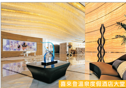
喜來登溫泉度假酒店大堂

由著名建築師馬岩松設計，外觀形狀可謂國際首創、中國唯一，是一座高100米、寬116米的指環形建築，建於湖面之上，2013年獲安波利斯摩天大樓獎銅獎。而內部裝潢高檔奢華，大堂天氣佈滿水晶燈，璀璨奪目，極具氣派。總建築面積6.47萬平方米，共有27層樓，300多間客房，面積39平方米起，更設水療中心、泳池、健身中心等設施。晚上亦可步行到漁人碼頭，欣賞南太湖美侖美奐的夜景及享用美食。