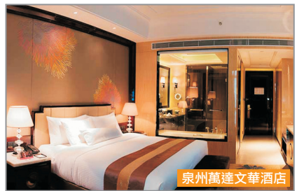
泉州萬達文華酒店