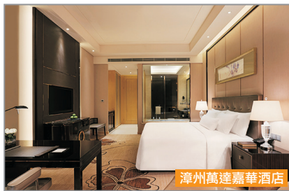
漳州萬達嘉華酒店