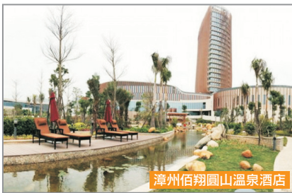
漳州佰翔圓山溫泉酒店