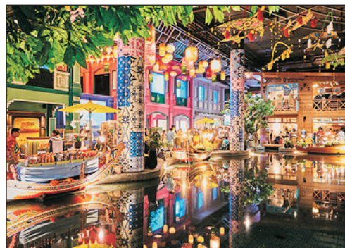
ICONSIAM ~ SookSiam

*KAAN SHOW因場地噪音問題，不足四歲小童恕不招待，另同行者如須照顧小童而自行放棄，則不設退款，敬請留意。