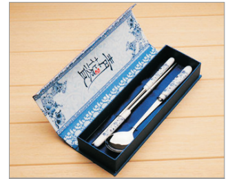
【精美紀念品】 景德鎮青花瓷餐具(每位一套)