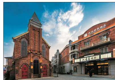
《全程3晚保證入住》 武漢君亭酒店(漢口大旅館)