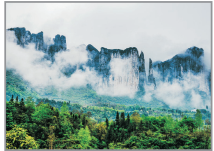
七星寨景區～百里絕壁