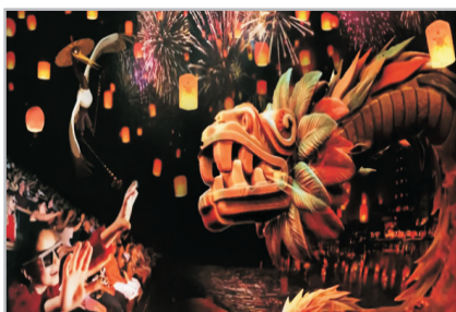
5D魔法影院《魔法袖傳奇》