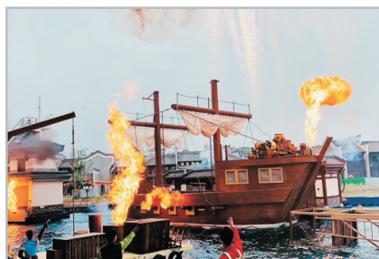
黑石號水上特技秀