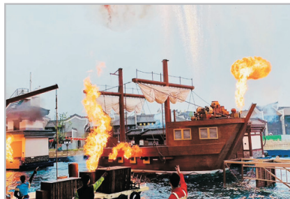
黑石號水上特技秀