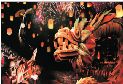
5D魔法影院《魔法袖傳奇》