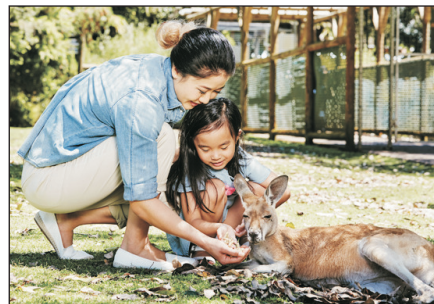
卡弗沙姆野生動物園

* 弗里曼圖週末市集營業時間為逢星期五、六及日。如有任何時間上更改，均以當局公佈為準。